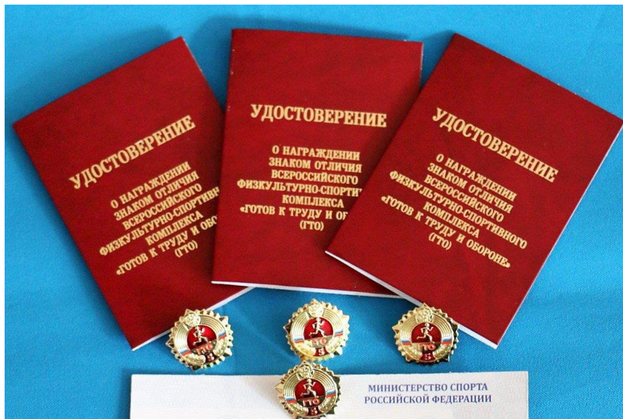
Рис.3. Наградные документы участников ФСК ГТО.