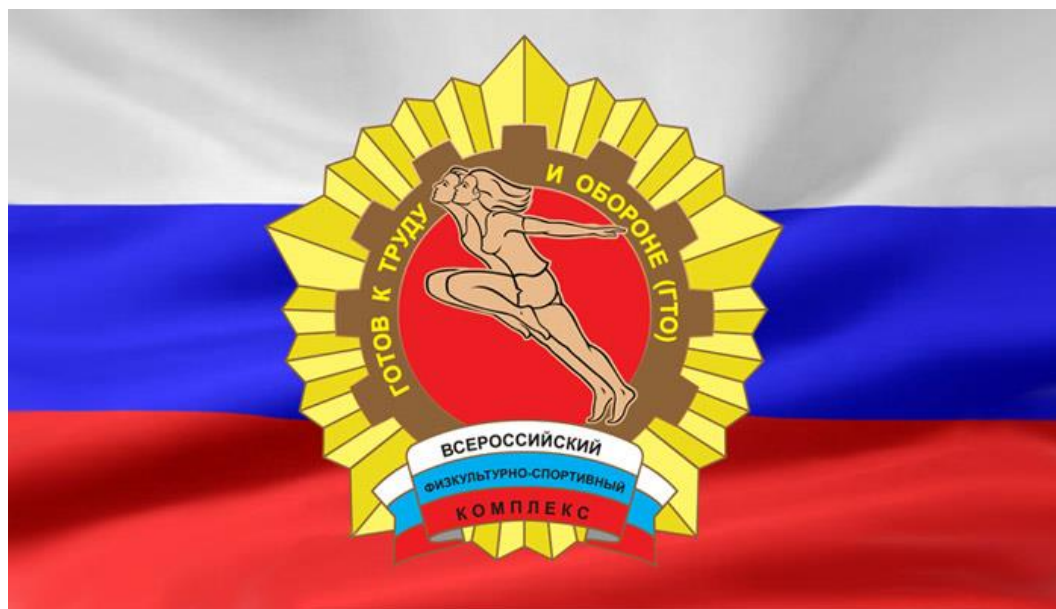
Рис.4. Эмблема ГТО